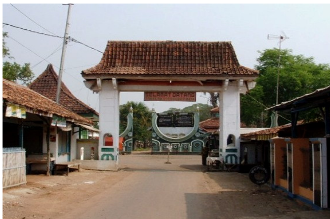
Joglo Pintu Gerbang Makam Syeck Quro; dibangun tahun 1987.