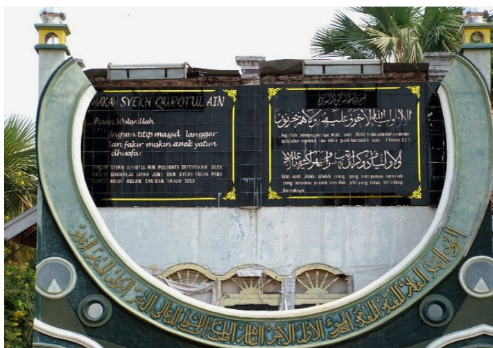
Majlis Syeck Quro sebagai pengingat sejarah penemuan makam Syeck Quro dan amanahnya; Dibangun tahun 2003