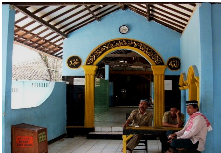
Pintu masuk Makam Syeck Quro direnovasi oleh ketua LKMD (Ito Suwito) tahun 2002