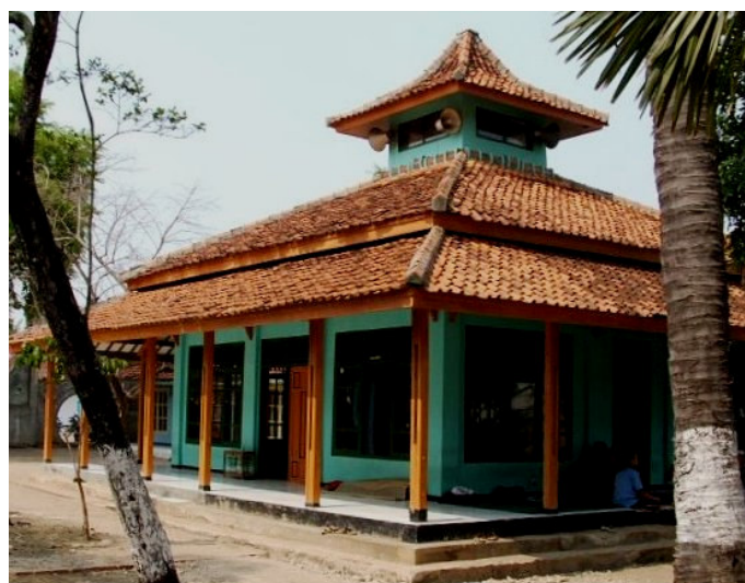
Masjid Syaikh Quro dibangun tahun 1987, dengan dana APBD I.