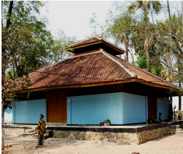
Rumah Makam Syekh Quro, direnovasi oleh APBD I tahun 2002.