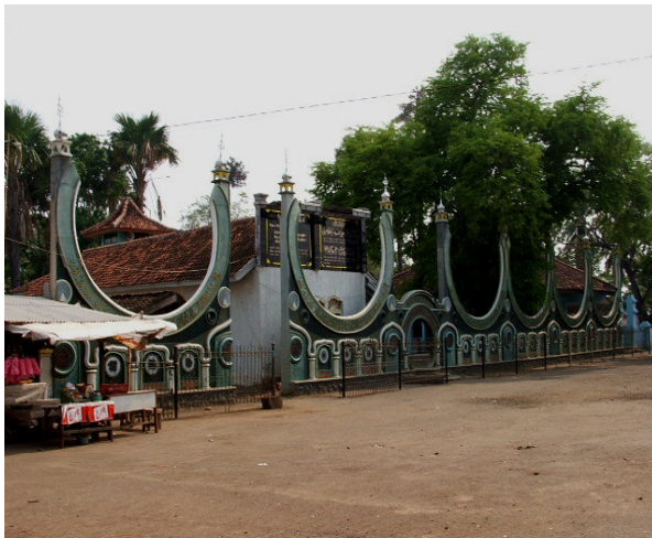
Benteng Asmaulhusna, dibangun oleh Kepala Desa Pulokelapa tahun 2004.