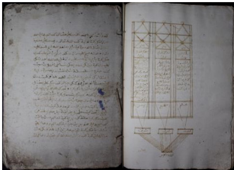
Foto Naskah Tarekat Naqsyabandiyah, Sumatera Barat