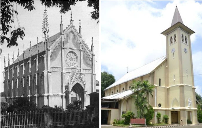
Sebelah Kiri: Gereja Katedral awal bernama Roomsche Katholieke Kerk dan Sebelah Kanan: bangunan gereja saat ini dengan tambahan menara pada saat pemugaran pertama di tahun 1938.

umat Kristiani setiap tahun seperti saat merayakan Natal Oikumene. Selain melihat dari dekat bangunan utamanya Anda juga akan menjumpai tiga buah lonceng pemberian Mr. Scharpf pada tahun 1923. Lonceng ini diletakkan dalam sebuah menara di sisi selatan gereja. Menara ini pun sudah berkali-kali mengalami perombakan dengan pertimbangan estetika.