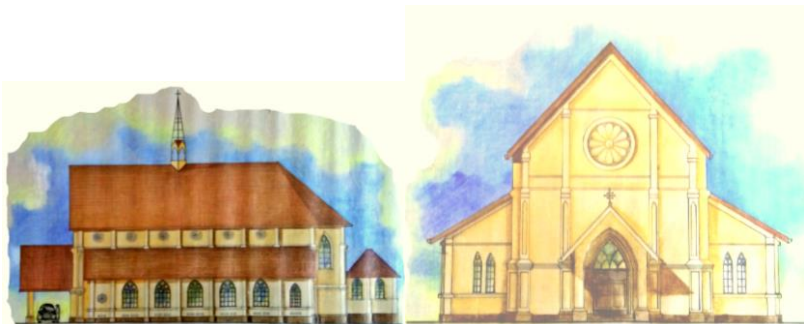
Gereja tampak samping dan depan