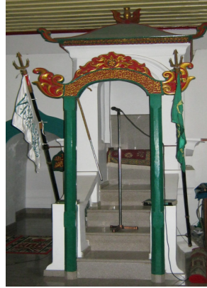
Mimbar Masjid Katangka, Gowa, Sulawesi Selatan