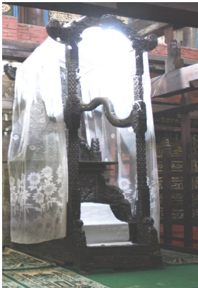
Mimbar Masjid Sang Cipta Rasa Kasepuhan Cirebon