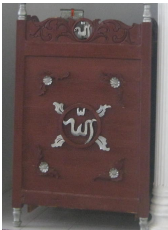
Podium pada salah satu masjid di Aceh Selatan