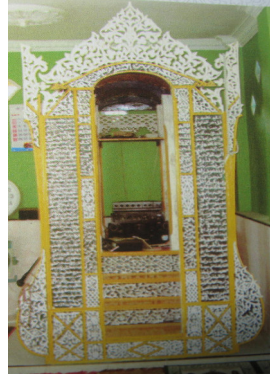
Mimbar Masjid Baiturrahim, Gempong Tualang Aceh Timur (Kanwil Kem. Agama Provinsi Aceh, Masjid Bersejarah di Nanggroe Aceh , Jilid I, 2009)