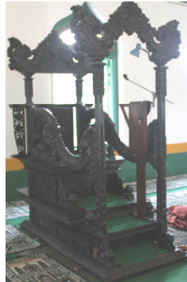
Mimbar Masjid Al-Wustho, Mangkunegaran Solo ( doc. Alfa Firmanto )