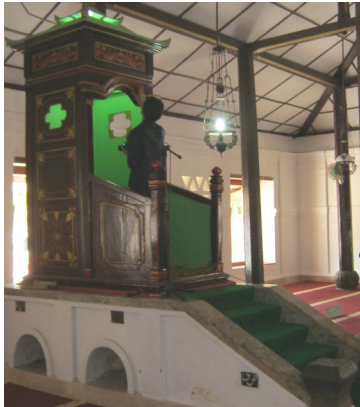
Mimbar Masjid Agung, Banten Lama, Serang