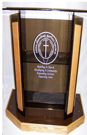
Podium pada salah satu gereja di Amerika ( http://www.churchfurniture.us )